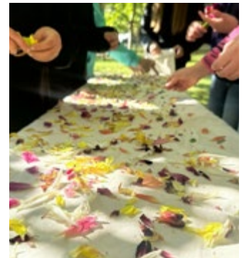
Kulturwandertage 2025: Drucken und Färben mit Pflanzen.

Die Kulturwandertage, organisiert vom Kulturamt Bielefeld, fanden vom 29. September bis 10. Oktober statt. In liebevoll vorbereiteten Workshops, die von freien Mitarbeiter:innen durchgeführt wurden, konnten die Schülerinnen und Schüler die Themen des Museums und darüber hinaus auf künstlerische Weise erkunden. In Kleingruppen – ganz anders als im üblichen Klassenverband – entstanden dabei kleine Kunstwerke: Collagen, Aquarelle, Kartoffeldrucke, gefärbte Stoffe mit Naturmaterialien und Schönschriftproben. Die offene, naturnahe Atmosphäre und die intensive persönliche Betreuung ermöglichten den Kindern ein inspirierendes, handlungsorientiertes Erlebnis, bei dem sie sich frei ausprobieren und ihre eigenen gestalterischen Ideen umsetzen konnten.