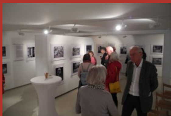
Gäste und Ehrenamtliche im Austausch.