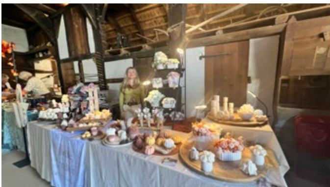
Frühjahrsmarkt Gesamtansicht des Museums und Marktstände im Haupthaus.