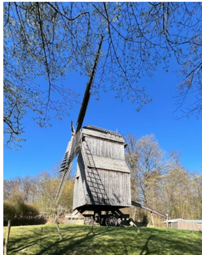
Bockwindmühle im Museum.

Am Mühlentag, 9. Juni, konnten die Besucher:innen die historische Mühlentechnik von Bockwindmühle und Bokemühle erleben. Bei den Mitmach-Angeboten in der Bockwindmühle legten Groß und Klein selbst Hand an und mahlten Korn mit einer Handmühle. Ergänzend boten Führungen spannende Einblicke in die Geschichte der Mühlen, begleitet von der Demonstration der Bokemühle. Frisches Brot aus dem Backhaus sorgte für Genuss und rundete den Mühlentag in angenehmer Atmosphäre ab.