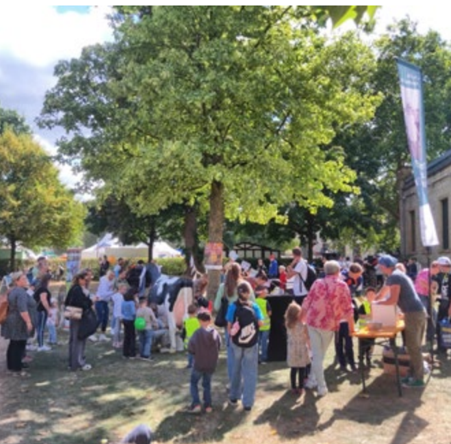
Gewusel am Wackelpeter-Stand.

Auch in diesem Jahr war das Bauernhausmuseum auf dem Kinder-Kulturfest Wackelpeter am 24. August vertreten. Als gut sichtbare Landmarke diente die beliebte Melk-Kuh, an der über 150 Kinder erfolgreich ihr „Melkdiplom“ ablegten. Ergänzt wurde das Angebot durch zahlreiche Mitmachaktionen. Stichworte sind: Gemüse- und Obst-Fühlkiste, Verkleidungsecke mit historischen Schürzen, Holz-Pantoffeln, Seilspringen, Tauziehen und Stelzen laufen. Von den rund 35.000 Besucher:innen des Wackelpeters konnten wir am Stand des Bauernhausmuseums 777 Kinder und Erwachsene zählen – tatsächlich dürften es noch mehr gewesen sein.