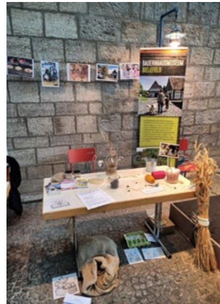
Slow Market 2025, Stand des Bauernhausmuseums im Historischen Museum.

Beim Slow Market am 4. Dezember im Historischen Museum Bielefeld war ein Stand des Bauernhausmuseums dabei. Der Slow Market ist ein Markt der Nachhaltigkeit und auf dem Dinge getauscht, weitergegeben, upgecycelt und gemeinsam kreativ gestaltet werden; es gab viele Mitmach- und Tauschangebote rund um nachhaltigen Konsum und DIY-Aktionen.