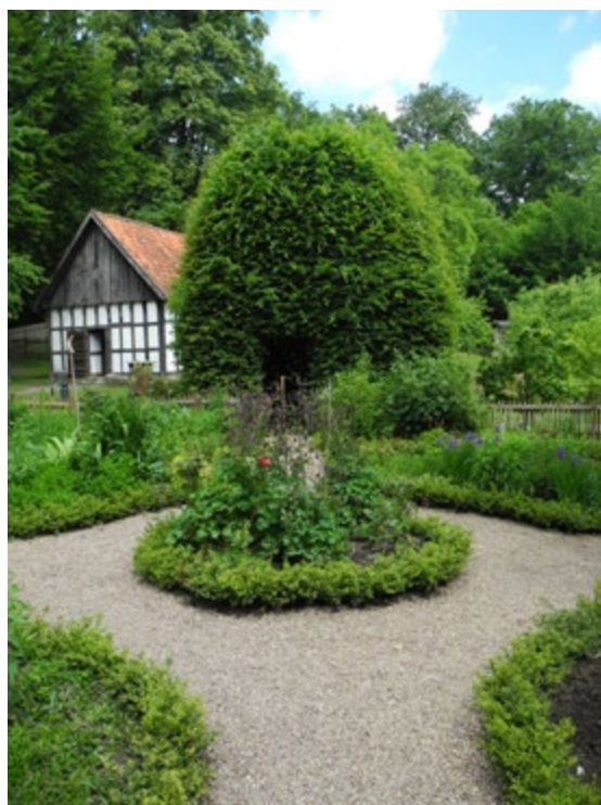
Bauerngarten mit neuer Buchsbaumhecke und aufgefrischten Kieswegen.