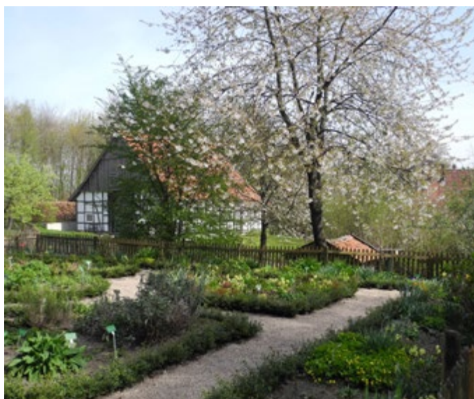
Neue Hecke im Garten hinter dem Haupthaus nach Pflanzung durch die Firma Stiegchorst – Garten- und Landschaftsbau, Bielefeld.

Übrigens: Es gibt im Bauernhausmuseum an anderer Stelle eine alte, sehr hohe und große Buchsbaum-Hecke. Diese ist bis heute so gut wie zünslerfrei.