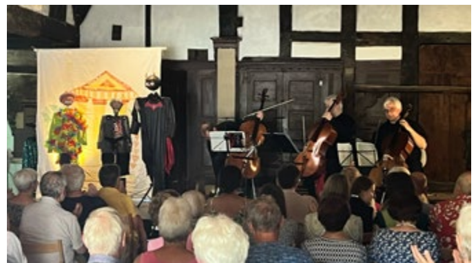
Die Zauberflöte – gestrichen.