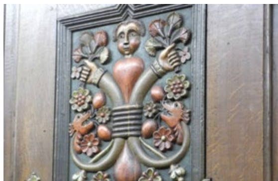
Detail eines beschnitzten „Troddelschranks“, eines ungewöhnlich aufwendig gearbeiteten ländlichen Möbels aus dem Ravensberger Land. Diese hochwertigen Produkte entstanden zwischen etwa 1806 und 1820 in einer anonymen Spezialwerkstatt, die in der Umgebung von Eickum (Stadt Herford) gelegen haben muss. Derartige Möbel werden 2026 im Bauernhausmuseum zu sehen sein.